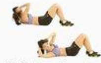
22 Oblique Crunch