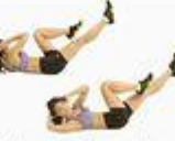
23 Bicycle Crunch