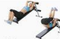
25 Reverse Crunch