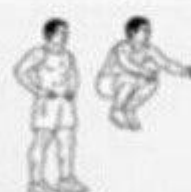
jump knee tucks